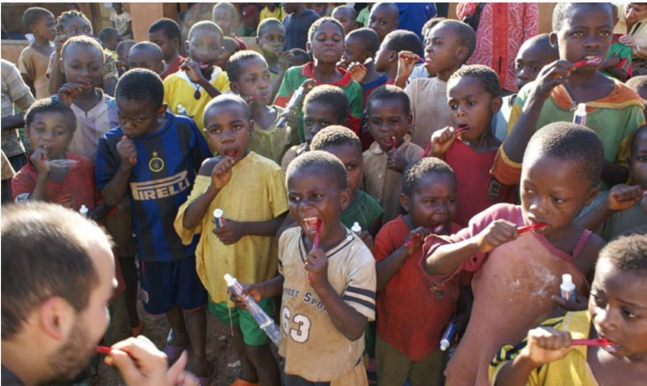
Reparto de pasta y cepillos en la escuela de Adjoli.